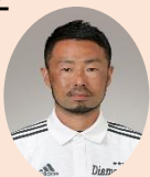
じゅんぺいコーチ ★パルシューレC級指導員 中学校保健体育教員