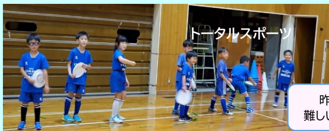
トータルスポーツ

柔軟性、俊敏性、バランス能力など、幅広い運動能力を身に付けることを目的とし、ルールの中で仲間と楽しくスポーツができるよう指導していきます。