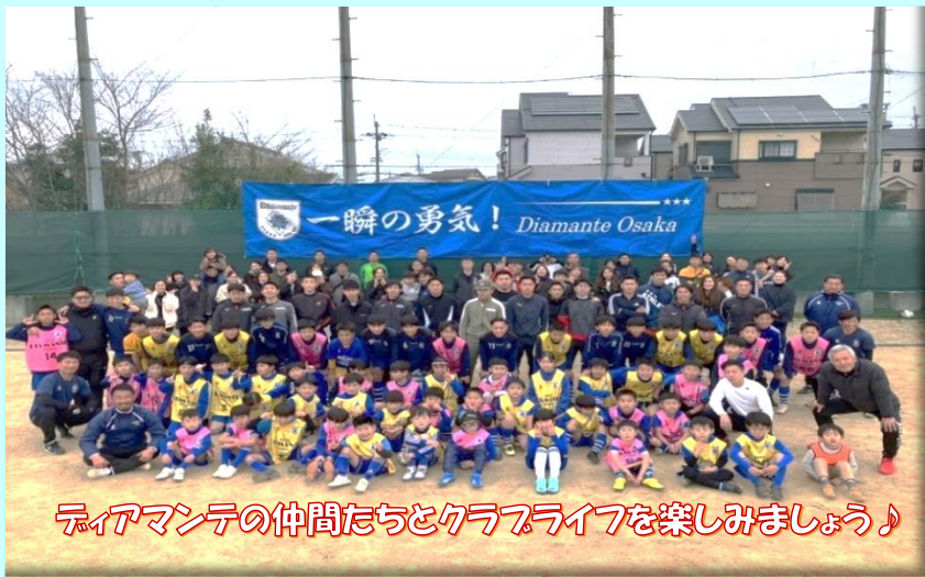
ダイヤモンドの仲間たちとクラブライフを楽しみましょう♪

文部科学省提唱 総合型・地域スポーツクラブ 主催 NPO法人 スポーツクラブダイヤモンド 支援 岸和田市教育委員会生涯学習部スポーツ振興課